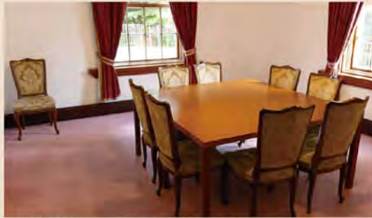
客室に入ると、明治時代にタイムスリップしたかのような感覚に。