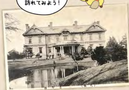
完成当時の豊平館