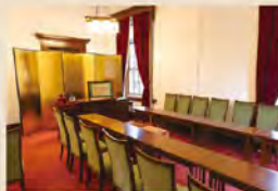
結婚式やパーティーなどで利用できるレンタルルームもあります。お問い合わせを。