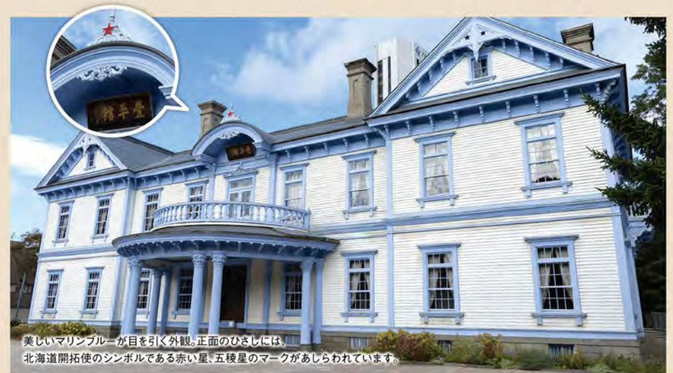
美しいマリンブルーが目目を引く外観。正面のひさしには、北海道開拓使のシンボルである赤い星、五稜星のマークがあらわれています。

開拓使によって建てられた最も重要な建築物の一つ 豊平館は北海道開拓使が直営する洋風ホテルとして建てた唯一のホテルです。1880(明治13)年11月に建築され、明治天皇が札幌・北海道の視察に訪れた1881(明治14)年に開館。現存する木造ホテルとしては国内最古の建物であり、明治・大正・昭和と3代にわたり天皇家が訪れた由緒あるホテルです。日本の伝統的技術を駆使した明治初期を代表する木造洋風建築で、1964(昭和39)年に国指定重要文化財に指定されています。建設当時は大通公園1丁目のあたりに建てられました。1958(昭和33)年に中島公園内に移築され、2011(平成23)年まで札幌市営結婚式場として利用されてきました。2016(平成28)年に保存修理工事を終え、交流施設と