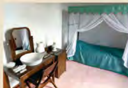
当時の寝間が再現されています。