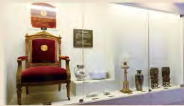
皇太子殿下(大正天皇)御使用の椅子など、行幸・行啓関連資料を展示。

開拓使によって建てられた最も重要な建築物の一つ 豊平館は北海道開拓使が直営する洋風ホテルとして建てた唯一のホテルです。1880(明治13)年11月に建築され、明治天皇が札幌・北海道の視察に訪れた1881(明治14)年に開館。現存する木造ホテルとしては国内最古の建物であり、明治・大正・昭和と3代にわたり天皇家が訪れた由緒あるホテルです。日本の伝統的技術を駆使した明治初期を代表する木造洋風建築で、1964(昭和39)年に国指定重要文化財に指定されています。建設当時は大通公園1丁目のあたりに建てられました。1958(昭和33)年に中島公園内に移築され、2011(平成23)年まで札幌市営結婚式場として利用されてきました。2016(平成28)年に保存修理工事を終え、交流施設と