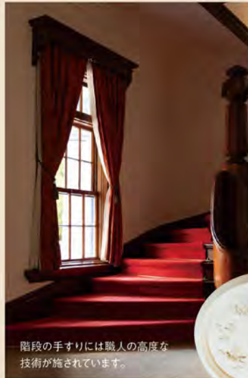
階段の手すりには職人の高度な技術が施されています。