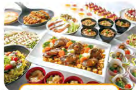
中央区役所前停留場