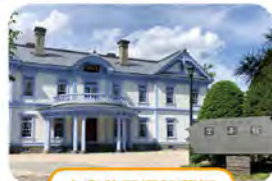
中島公園通停留場

札幌もいわ山ロープウェイ 札幌もいわ山ロープウェイ・ ミニケーブルカー 往復料金割引