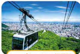
ロープウェイ入口停留場

札幌もいわ山ロープウェイ 札幌もいわ山ロープウェイ・ ミニケーブルカー 往復料金割引