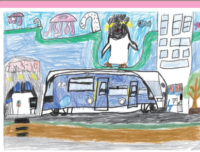
小学生低学年の部